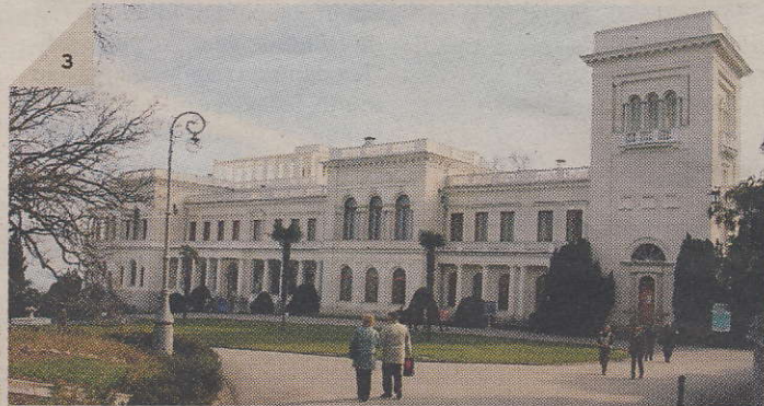
–1– Algselt ühekorruselisest hoonest on saanud kolmekorruseline pansionaat. –2– Eestianna Eda Golovko oma puhkemaja lähel –3– Turistide tõmbenumber Livadija palee